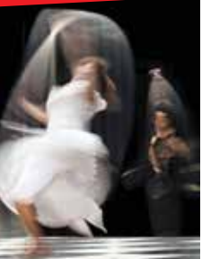
Échecs & Mâts

ÉCHECS & MÂTS Mardi 10 octobre - 20h30 (dès 11 ans) Écrire à partir du jeu d'échecs pour comprendre, décrypter nos comportements de joueurs, mettre en scène la soumission, la violence, les cases dans lesquelles chacun de nous est enfermé. Création Cie La Fabrique des Petites Utopies Mise en scène Bruno Thircuir