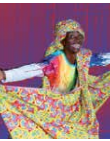
La farce de Maître Pathelin