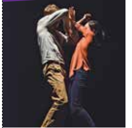
Meet me halfway

MEET ME HALFWAY Mardi 12 décembre - 20h30 (dès 6 ans) Après Into Outside dansé en novembre 2016, la Cie Beaver Dam nous présente une nouvelle composition chorégraphique où la rencontre entre les interprètes est célébrée comme une ode à la décélération et à la découverte. Le chorégraphe suggère un espace de fragilité propice à la transformation de l'être. Création Cie Beaver Dam, en résidence à L'Auditorium Seynod Chorégraphie Édouard Hue