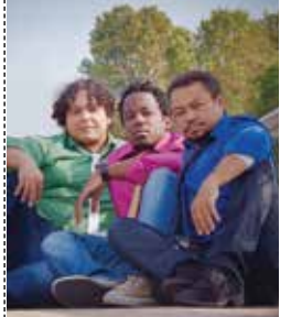
C. A. B.