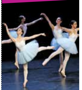
Les saisons dansées

LES SAISONS DANSÉES Conservatoire Annecy Jeudi 7 juin - 18h30 / 20h30 & Samedi 9 juin - 16h / 19h Spectacles des classes du Département Danse du Conservatoire d'Annecy : classique, contemporain, jazz et hip-hop.