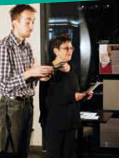
Lecture au Grain de Sel

LECTURES - SPECTACLES au Restaurant « Le Grain de Sel » à Seynod Entrée libre avec formule repas facultative Cinq soirées réparties tout au long de la saison – durée 1h