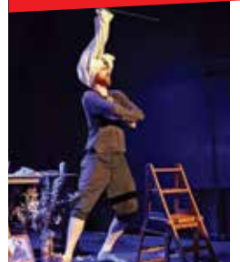
Le chant du cygne

LE CHANT DU CYGNE d'après Anton Tchekhov Mardi 27 février - 20h30 (dès 12 ans) Un théâtre en pleine nuit. Lieu de tant de souvenirs et d'enchantements pour le vieux comédien qui s'y est endormi après avoir bu quelques verres de trop à l'occasion de son gala. Un magnifique témoignage d'artiste. Création Cie du Passage Mise en scène Robert Bouvier