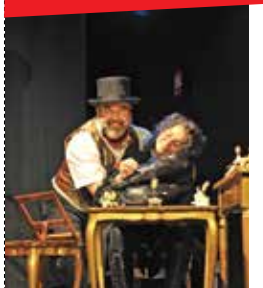
L'extraordinaire univers illustré de Jules Verne

L'EXTRAORDINAIRE UNIVERS ILLUSTRÉ DE JULES VERNE (dès 6 ans) Mardi 17 oct. - 19h & Mercredi 18 oct. - 14h30 Savez-vous pourquoi Jules Verne a écrit 20 000 Lieux sous les mers ? C'est parce que George Sand le lui a suggéré ! Voilà ce que l'on apprend dans ce spectacle. Cie Octopus / Spectacle joué en salle de répétition