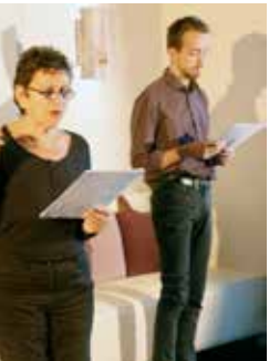
Lecture au Grain de Sel

L'Italie sera à l'honneur avec les nouvelles de