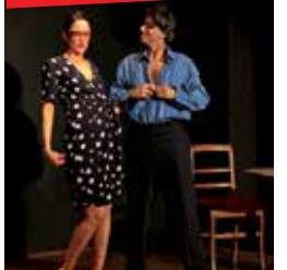
Les visages de l'amour