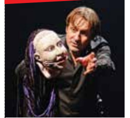
The Macbeth's show

GABRIELLE BLANC POLICE ! de François Régis Marchasson Mardi 27 mars - 20h30 (dès 14 ans) Gabrielle Blanc Police ! C'est une femme de 50 ans, commissaire principale à la Brigade de Répression du Proxénétisme, qui fait son pot d'adieu. Création Cie Electron libre/ M.en S. Chantal Deruaz