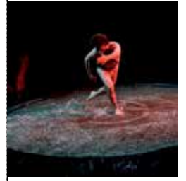
Je suis un saumon

THE MACBETH'S SHOW d'après Shakespeare Jeudi 29 mars - 20h30 (dès 15 ans) Les mésaventures d'un homme avide de pouvoir soutenu par son épouse. Dans ce show, Didier Carrier incarne à lui seul plus de 20 personnages ! Cie du Solitaire / M.en S. Camille Giacobino